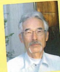
つばき お馴染みの顔!!