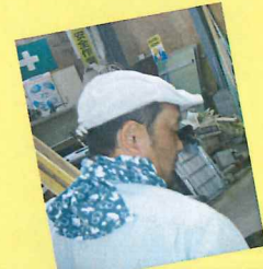
かとう コワモテ担当 ✖