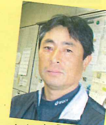
きたむら 垣マスター!!