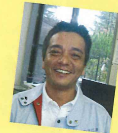
いしはら マダムキラー!!