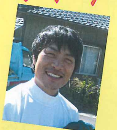
さかた 遅咲きのルーキー!!