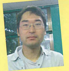
くろかわ ♡ 花嫁募集中です